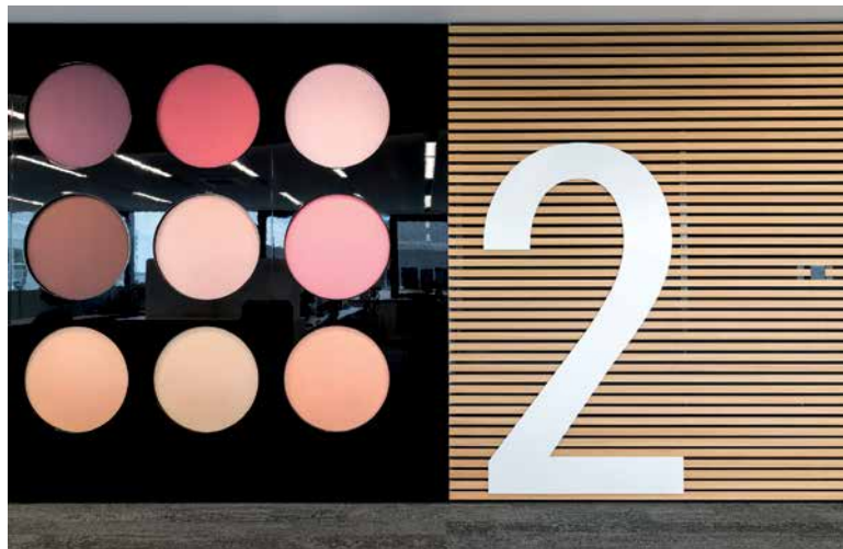
↑ V interiéru můžeme najít prvky inspirované kosmetikou.