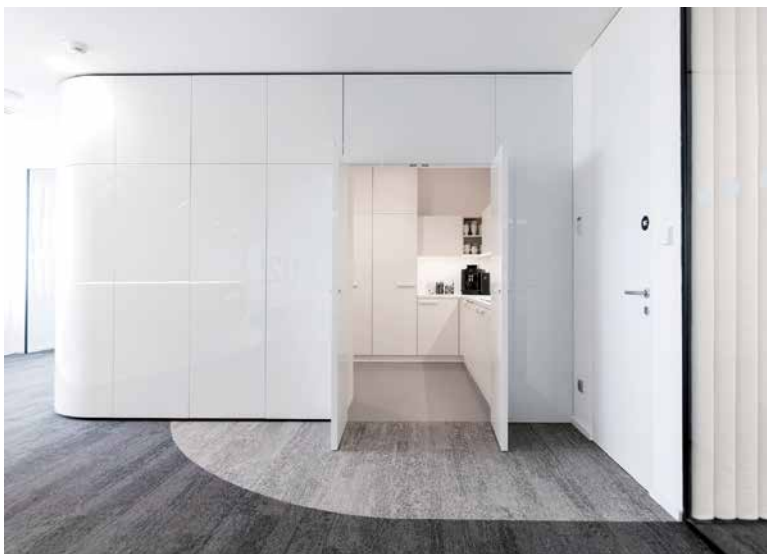
↑ Elegantní kuchyňka

Jde o ojedinělý koncept, kdy zadavatel poskytl architektům dostatek prostoru a do návrhu zasahoval zcela minimálně. Architekti tak nebyli nuceni činit ve svém záměru jakékoli výrazné ústupky. S návrhem se architektonický ateliér rozhodl zúčastnit několika soutěží, jako například Zasedačka roku, Fit-out roku či Kanceláře roku.