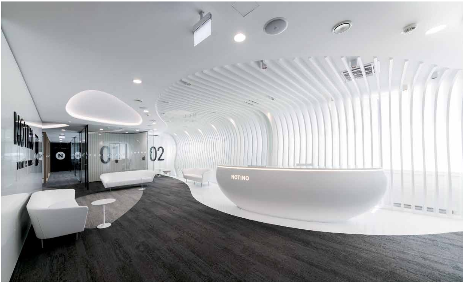
↑ Za architektonickým návrhem interiéru stojí ateliér Kyzlink Architects.