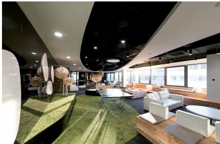
↑ Architektům se podařilo vytvořit netradiční prostor za použití kvalitních moderních prvků.